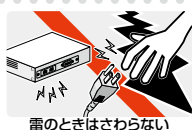
雷のときはさわらない

異物は入れない 水は禁物 火災や感電のおそれがあります。水や異物を入れないように注意してください。万一水や異物が入った場合は、電源プラグをコンセントから抜いてください。