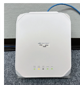
▲ AT-TQ6602 GEN2