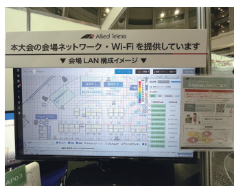
▲ AT-Vista Manager EXで会場の無線LANを視覚化①