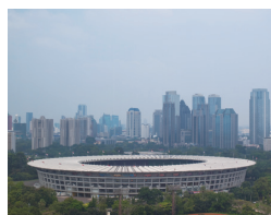
第18回アジア競技大会 (2018 ジャカルタ・パレンバン)