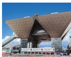
東京モーターショー 2019