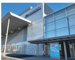
第42回医療情報学連合大会