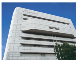
青雲クラウンビジネス ソリューションフェア 2019