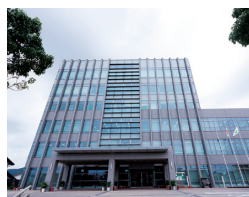
田原市 スポーツイベントへの取り組み