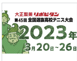
全国選抜高校テニス大会

数多くのイベント会場で培ったITインフラ構築の豊富な実績とノウハウがあります。経験豊富な当社にお任せください。