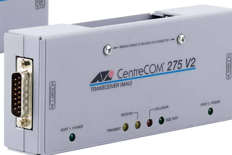
CentreCOM® 275 V2