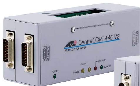
CentreCOM® 445 V2