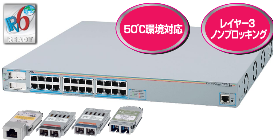
AT-G8T AT-G8SX AT-G8LX AT-G9ZX

CentreCOM 8724SLは10BASE-T/100BASE-TXポートを24ポート装備し、高さを1Uサイズに抑えたレイヤー3 ファーストイーサネット・スイッチです。標準のポート以外にGBIC スロットを2つ装備し、増設ポートとして1000BASE-T、1000BASE-SX、1000BASE-LX、または1000M SMF (90km)を実装することが可能です。