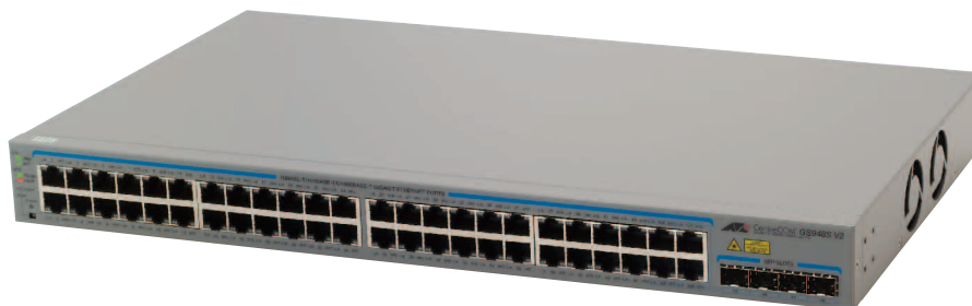
CentreCOM® GS948S V2

CentreCOM GS948S V2は、10/100/1000BASE-Tポート（自動認識）を48ポート装備し、SFPスロットを4ポート（コンボ）装備したギガビットイーサネット・スマート・スイッチです。SFPスロットは、オプション（別売）のSFPモジュールを追加することにより、ギガビット光ポートの実装が可能です。