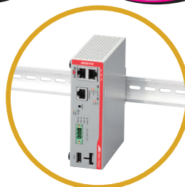
オプション (別売) の DIN レールマウントキット [AT-DRMT-J02] を使用した設置例